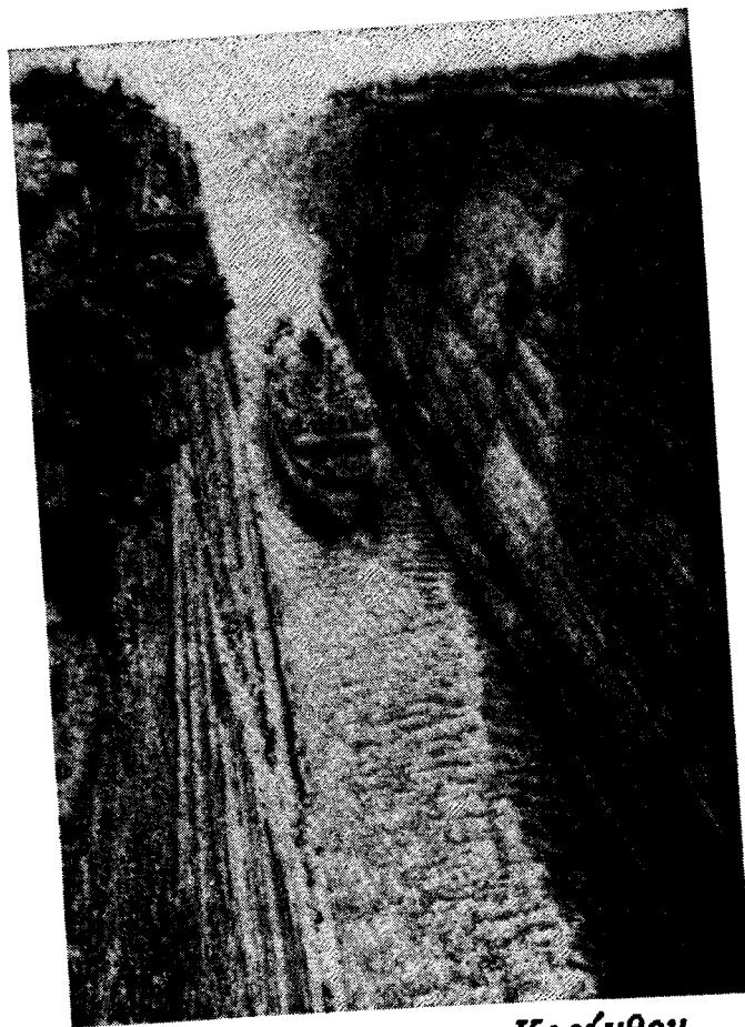
Η Διώρυγα της Κορίνθου