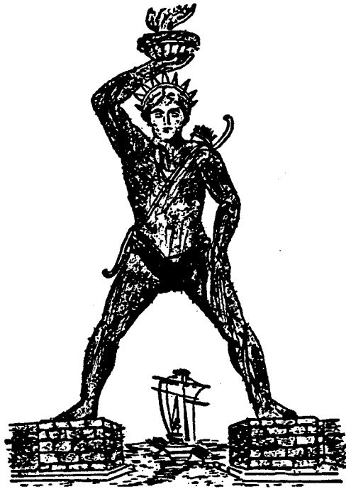
Ο Κολοσσός της Ρόδου

η ακτή - coast, beach η κοιλάδα - valley η πεταλούδα - butterfly